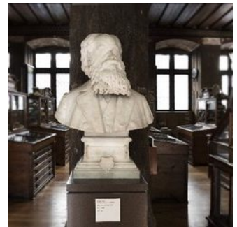
Büste des Museumsgründers Ludwig Leiner