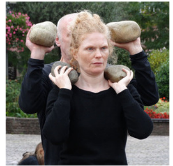
© Gisela Hochuli Performance Gisela Hochuli