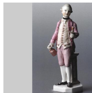
Kammerdiener mit Tablett, Zürcher Porzellanmanufaktur, um 1780/85