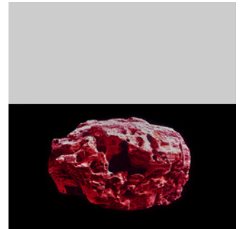
© Pilz Fotodesign Franziska Rutishauser, Stranger 7 - Wandering matter, 2019