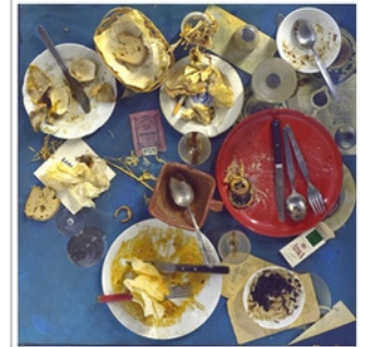
Daniel Spoerri, Aktion "Restaurant Spoerri" in Düsseldorf vom 16. November 1972