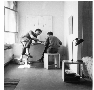
Blick in ein Studentenzimmer im Wohnturm der HfG, 1956