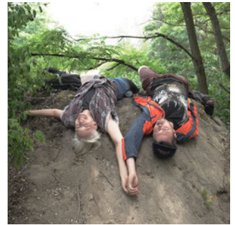
© Rémy Markowitsch / Weltkulturerbe Völklinger Hütte