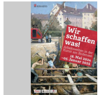
Plakat Ausstellung Wir schaffen was 2024