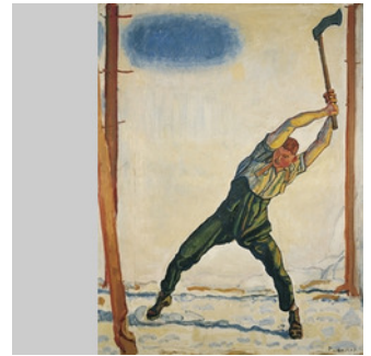
Ferdinand Hodler, Der Holzfäller, 1908/1910, Von der Heydt-Museum Wuppertal