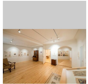
© Adolf Hölzel Stiftung Hölzel-Haus Innenansicht