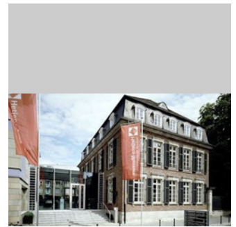
© Hetjens-Museum - Deutsches Keramikmuseum - Düsseldorf